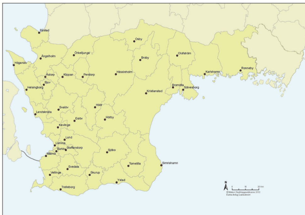
Figur 1: Samverkansavtalets 37 kommuner 1

Skollagen säger att "Varje kommun ansvarar för att ungdomarna i kommunen erbjuds gymnasieutbildning av god kvalitet" och att "Vilka utbildningar som erbjuds och antalet platser på dessa ska så långt som möjligt anpassas med hänsyn till ungdomarnas önskemål" (§30). Vidare anges att "Av de behöriga sökande till ett nationellt program ...ska huvudmannen i första hand ta emot dem som är hemmahörande i kommunen eller inom samverkansområdet för utbildningen" (§42).